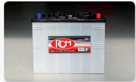
6 batterie 6V-320 Ah (5h) - (E) 6 batteries 6V-320 Ah (5h) - (E) 6 batterie 6V-320 Ah (5h) - (E)