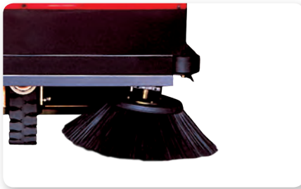
Braccio spazzola laterale sinistro Left side brush arm Brazo lateral izquierda