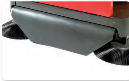
Convogliatore polvere Dust conveyor Encaminador de polvo