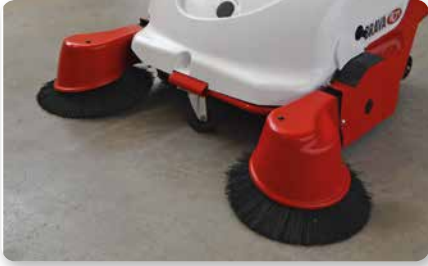
Braccio spazzola laterale sinistro Left side brush arm Brazo lateral izquierda