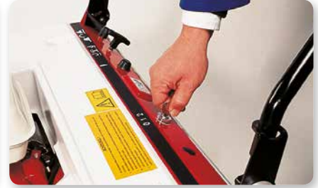
Scuotitore elettrico Electric start Arranque eléctrico