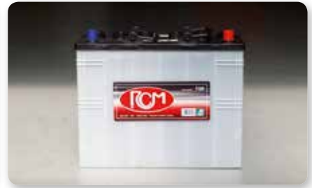
4 batterie 6V-270 Ah (20h) - (E) no.4 batteries 6V-240 Ah (20h) - (E) 4 batterie 240 Ah (20h) - (E)