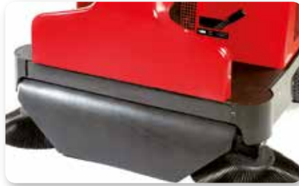
Convogliatore polvere Dust conveyor Encaminador de polvo