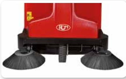
Braccio spazzola laterale sinistro Left side brush arm Brazo lateral izquierda